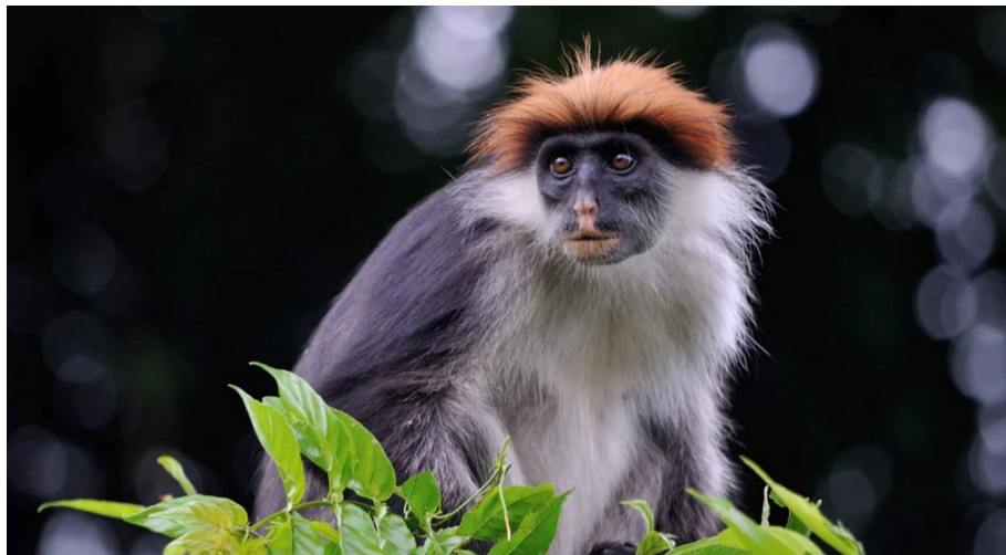
Rød Colobus.

udkom en flot bog om Udzungwa – Tales of discovery in an East African rainforest. Forsiden af bogen viser et af Steffens fantastiske foto: en Rød Colobus (se nedenfor). Med baggrund i bogen er det lykkedes at rejse ikke mindre end 30 millioner kroner til beskyttelse af området. Det foregår i et tæt samarbejde mellem forskerne og de lokale folk og myndigheder. 29 deltagere. Ole