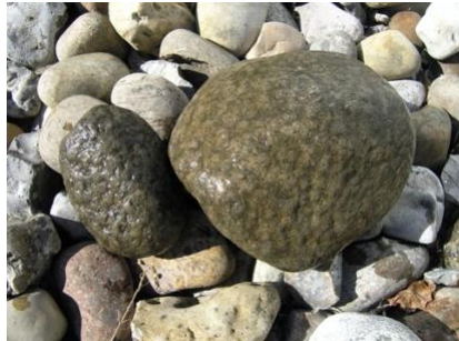
Rhombeporfyr fra Norge og Kinnekulle-diabas fra Sverige

Mødested: P-pladsen for enden af Sandskredsvej, 4500 Nykøbing Sj. 55.813365 N, 11.721343 Ø.