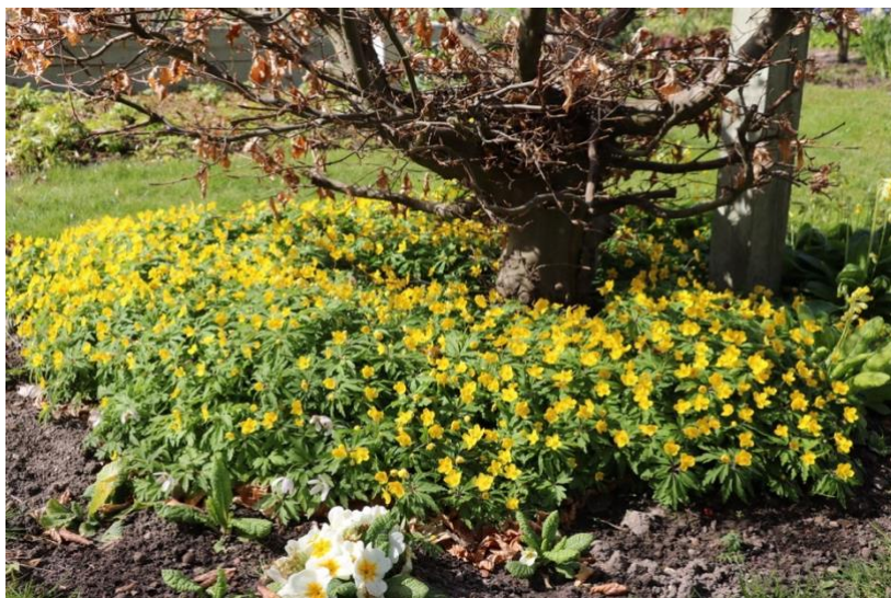
Gul anemone i selskab med Storblomstret- og Hulkravet kodriver