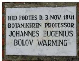
På Mandø fødtes botanikeren Warming