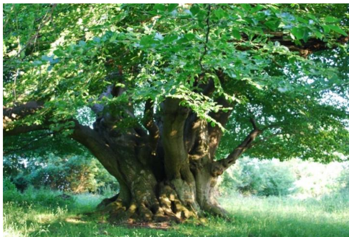
Gammel bøg i Rye dyrehave.