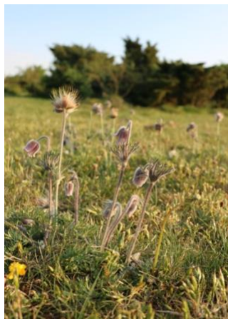
Nikkende kobjælder og Stor kejserguldsmed på Vesterlyng