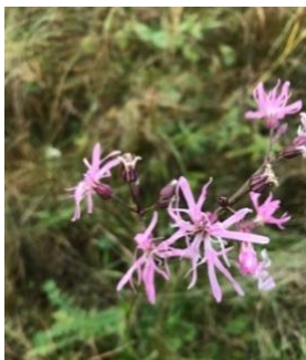
På strandengen på Mandø blomstrede årets blomst: Trævlekrone

Vi var rigtigt heldige med vejret på denne efterårstur til Vadehavet – vi fik regn men kun mens vi sov. Det var dog noget køligt; jo det var blevet efterår. På Sjælland mødte vi en Rød Glente, et godt tegn! Den første lokalitet var Sneum Digesø, den var ret fugletom men til gengæld var der godt med fugle udenfor diget, vi noterede blandt andet Gravand, Lille Kobbersnepe,