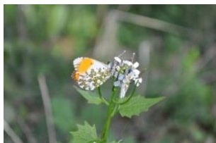
Aurora, han og hun på Løgkarse