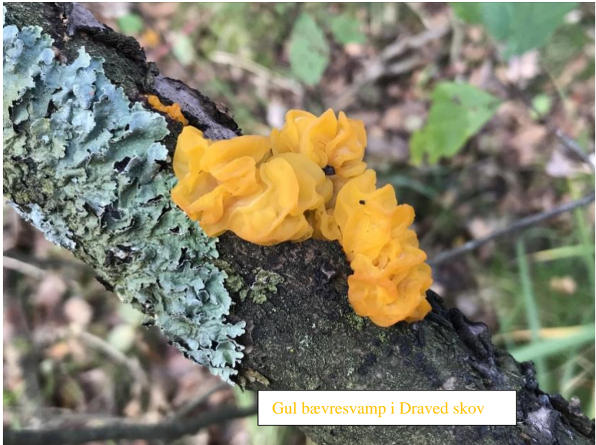
Gul bævresvamp i Draved skov